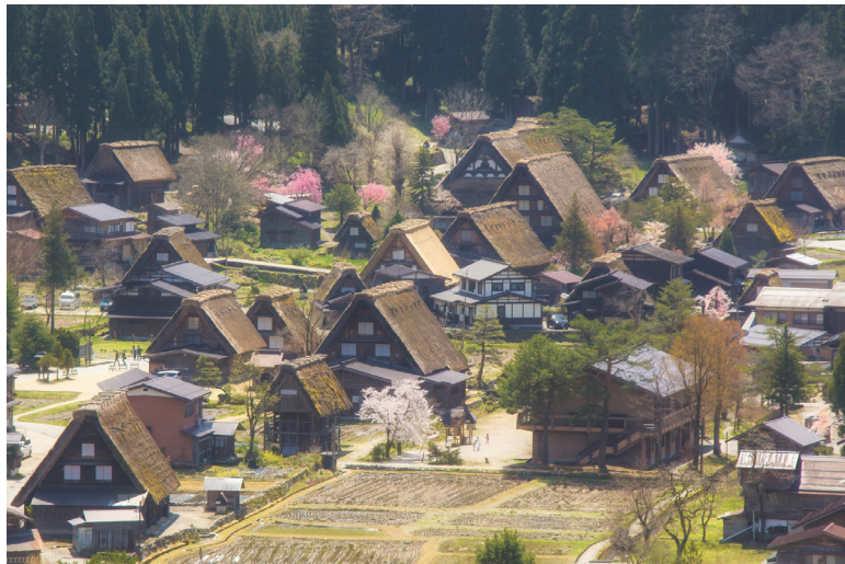
春の柔らかな光に包まれる白川郷・合掌造り集(岐阜県大野郡白川村)